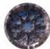
Rosassa de Santa Maria del Mar (AB-G.5em)

En definitiva, com en el primer volum d'arquitectura, els coordinadors d'aquest segon volum hem procurat, en el marc de la direcció editorial i científica, que els diferents articles no solament informin sobre l'estat actual del nostre coneixement de l'arquitectura gòtica, sinó també que donin les coordenades principals de la seva significació. Així mateix, hem reunit diverses novetats fruit de l'avenç de la recerca i de la interpretació derivada de la contemplació directa dels edificis. Per a això, hem comptat amb un valuós equip de col·laboradors format per qui més, i també per qui més de prop, coneix els continguts que s'hi apleguen i hem procurat, per damunt de tot, que la informació arribés al lector amb claredat, coherència i precisió. La consulta de tota la documentació gràfica que s'inclou (fotografies, mapes, planimetries, esquemes, quadres, imatges, etc.), la majoria realitzada expressament, així com els diversos índexs inclosos al final, seran de gran ajuda per a la navegació pels continguts del llibre i per a la descoberta de l'arquitectura gòtica catalana en tota la seva riquesa i diversitat.