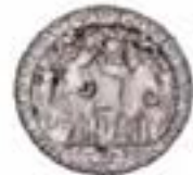
La Coronació de la Mare de Déu en una clau de volta de la catedral de Tarragona. (17-65.)

Així, doncs, aquest volum enceta una visió del mosaic ric i suggeridor de l'arquitectura gòtica que s'anirà desglossant temàticament en els altres dos volums d'arquitectura de L'art gòtic a Catalunya .